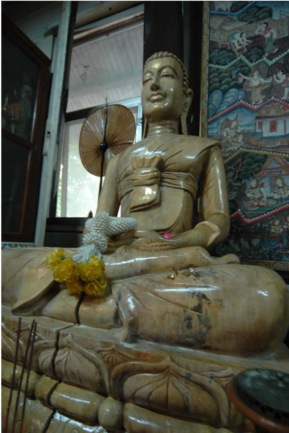
ภาพ รูปพระราหู